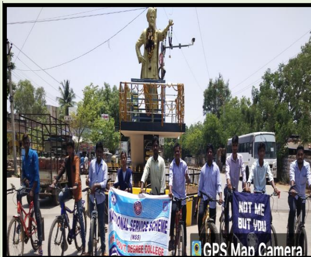
NSS Volunteers standing at the railway station